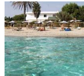
www.hrcostazul.com Anuncios Goooooogle