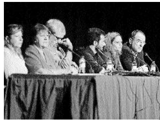
Hace un año se celebraron unas jornadas sobre salud mental e inmigración

Las asociaciones de las Pitiüses celebran el Día Mundial de este tipo de enfermedades con un congreso